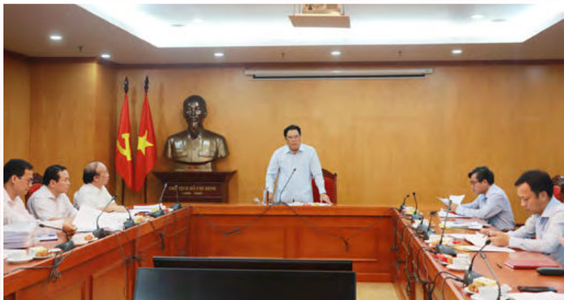
Đồng chí Sơn Minh Thắng, Ủy viên Ban Chấp hành Trung ương Đảng, Bí thư Đảng ủy Khối các cơ quan Trung ương chủ trì phiên họp Ban Thường vụ Đảng ủy Khối phê duyệt hồ sơ Đại hội Đảng bộ Bộ Tư pháp lần thứ XI, nhiệm kỳ 2020-2025