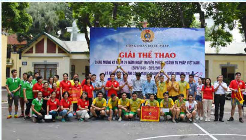
Các hoạt động thể dục, thể thao chào mừng kỷ niệm 74 năm thành lập ngành Tư pháp Việt Nam (28/8/1945-28/8/2019)