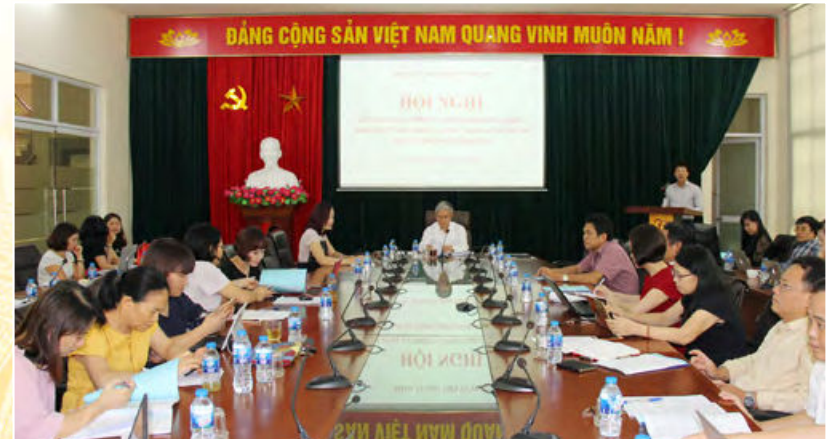
Đảng bộ Học viện Tư pháp tổ chức Hội nghị học tập, phổ biến Nghị quyết Trung ương 7 khóa XII (Hà Nội, ngày 03/8/2018)