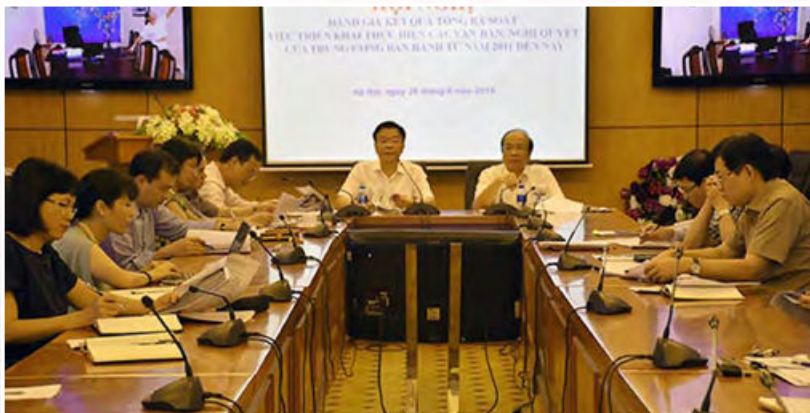
Bộ trưởng Lê Thành Long, Bí thư Ban cán sự đảng và Thủ trưởng Phan Chí Hiếu, Bí thư Đảng ủy chủ trì Hội nghị trực tuyến đánh giá kết quả tổng rà soát việc triển khai thực hiện các văn bản, nghị quyết của Trung ương từ năm 2011 đến nay (Hà Nội, ngày 28/6/2019)