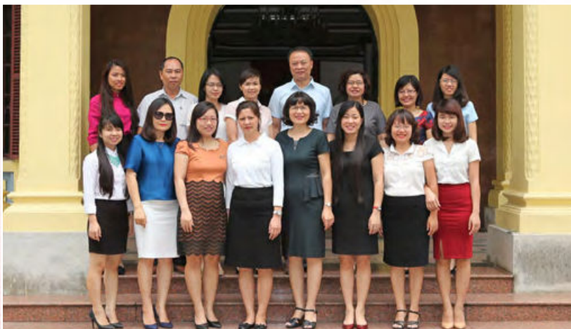
Tập thể đảng viên Chi bộ Cục Con nuôi