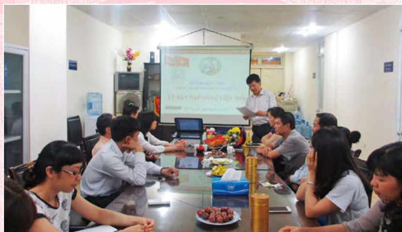
Chi bộ Tạp chí dân chủ và Pháp luật tổ chức kết nạp đảng viên mới (Hà Nội, ngày 26/5/2020)