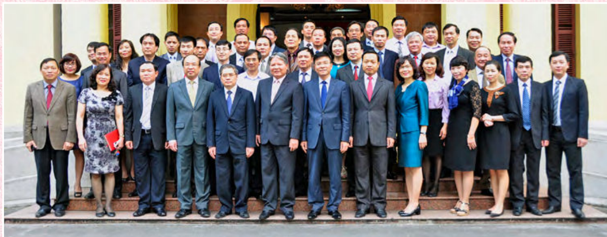
Ban chấp hành Đảng Bộ và Ban cán sự đảng cùng đội ngũ cán bộ chủ chốt của Bộ trong Lễ bàn giao nhiệm vụ Bộ trưởng Bộ Tư pháp (Hà Nội, ngày 13/4/2016)