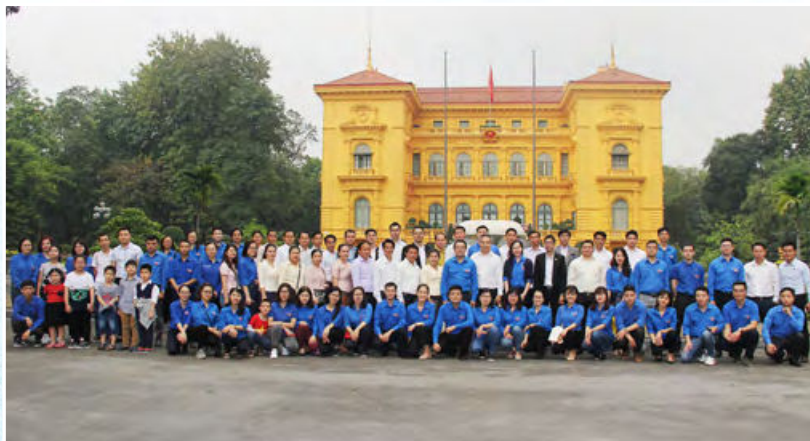
Đoàn Thanh niên Bộ Tư pháp Việt Nam và Đoàn Thanh niên Bộ Tư pháp Lào thăm Phủ Chủ tịch nước