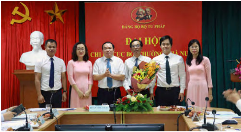
Ra mắt chi ủy tại Đại hội Chi bộ cơ sở Cục Bồi thường nhà nước nhiệm kỳ 2020-2025 (Hà Nội, ngày 19/5/2020)