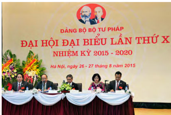
Đoàn Chủ tịch điều hành Đại hội đại biểu Đảng bộ Bộ Tư pháp lần thứ X, nhiệm kỳ 2015-2020