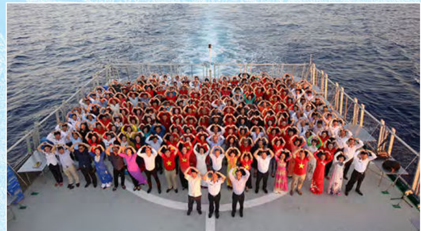
Đoàn cán bộ của Bộ Tư pháp tham gia Đoàn công tác đi thăm và làm việc tại quần đảo Trường Sa (Khánh Hòa, ngày 27/4/2019)