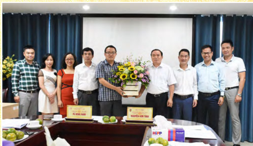
Đại diện Thường trực Đảng ủy Bộ tặng hoa chúc mừng Chi bộ cơ sở Nhà xuất bản Tư pháp tại buổi lễ công bố Quyết định kiện toàn cấp ủy nhiệm kỳ 2015-2020 (Hà Nội, ngày 05/3/2019)