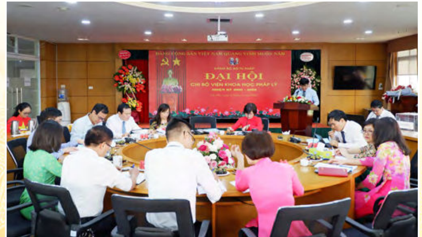
Đại hội Chi bộ Viện Khoa học pháp lý nhiệm kỳ 2020-2025 (Hà Nội, ngày 26/5/2020)