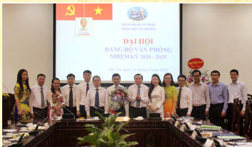
Đại hội Đảng bộ Văn phòng Bộ nhiệm kỳ 2020-2025 (Hà Nội, ngày 23/5/2020)