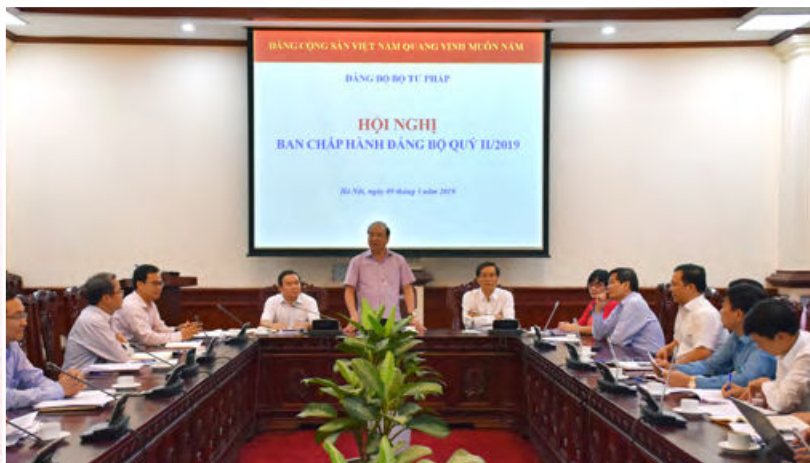
Hội nghị Ban Chấp hành Đảng bộ Bộ Tư pháp Quý II/2019 (Hà Nội, ngày 04/5/2019)