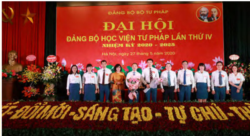
Ban Chấp hành Đảng bộ ra mắt tại Đại hội Đảng bộ Học viện Tư pháp lần thứ IV, nhiệm kỳ 2020-2025 (Hà Nội, ngày 27/5/2020)