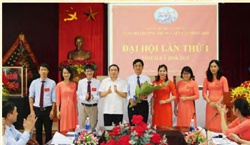
Ban Chấp hành Đảng bộ cơ sở Trường Trung cấp Luật Đồng Hới ra mắt tại Đại hội Đảng bộ lần thứ I, nhiệm kỳ 2020-2025 (Đồng Hới, ngày 25/5/2020)