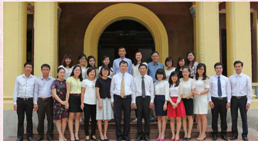
Chi bộ Vụ Các vấn đề chung về xây dựng pháp luật (Hà Nội, Tháng 8/2015)