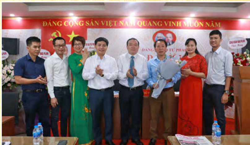
Thường trực Đảng ủy Bộ tổ chức chúc mừng Ban Chấp hành Đảng bộ Báo Pháp luật Việt Nam tại Đại hội Đảng bộ Báo Pháp luật Việt Nam lần thứ II, nhiệm kỳ 2020-2025 (Hà Nội, ngày 08/5/2020)