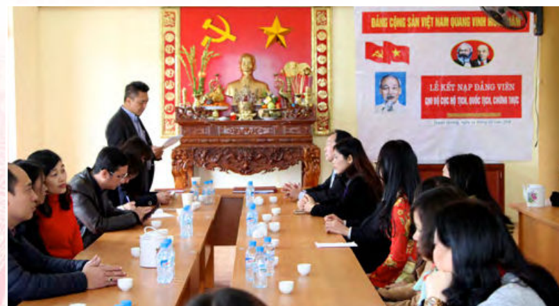
Chi bộ Cục Hộ tịch, quốc tịch, chứng thực tổ chức kết nạp đảng viên mới tại Khu di tích của Bộ Tư pháp (Tuyên Quang, ngày 19/02/2016)