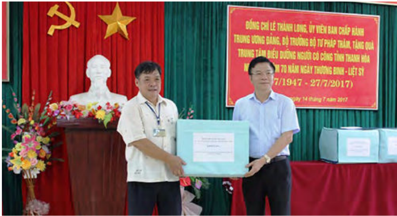
Bộ trưởng Lê Thành Long, Bí thư Ban cán sự đảng thăm và tặng quà Trung tâm điều dưỡng người có công tỉnh Thanh Hóa nhân Ngày Thương binh, liệt sĩ (Thanh Hóa, ngày 27/7/2017)