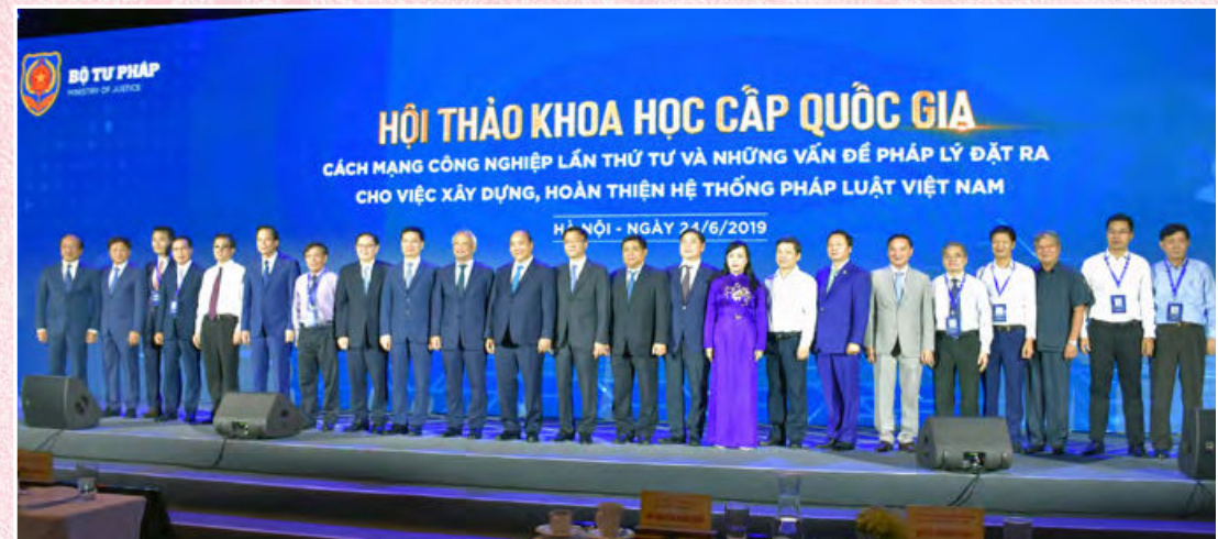
Lãnh đạo Đảng, Nhà nước và Lãnh đạo Bộ tại Hội thảo khoa học cấp quốc gia “Cách mạng công nghiệp lần thứ tư và những vấn đề pháp lý đặt ra cho việc xây dựng, hoàn thiện hệ thống pháp luật Việt Nam” (Hà Nội, ngày 24/6/2019)