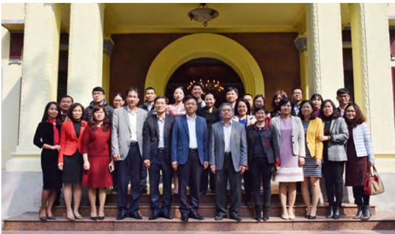
Đảng bộ cơ sở Cục Đăng ký quốc gia giao dịch bảo đảm (Hà Nội, năm 2019)