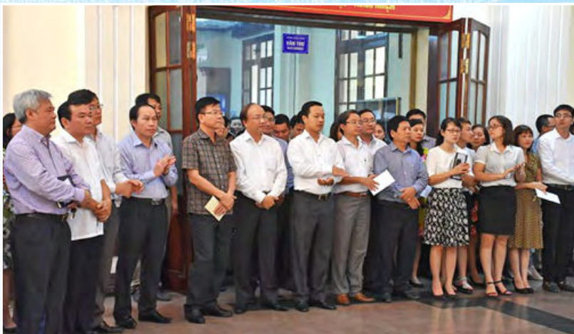
Ban cán sự đảng, Ban Thường vụ Đảng ủy Bộ cùng toàn thể công chức Bộ Tư pháp tại lễ phát động quyền góp ủng hộ đồng bào lũ lụt miền Trung (Hà Nội, ngày 17/10/2016)