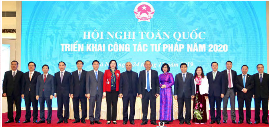
Lãnh đạo Đảng, Nhà nước và Lãnh đạo Bộ tại Hội nghị toàn quốc triển khai công tác tư pháp năm 2020 (Hà Nội, ngày 24/12/2019)