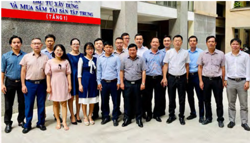
Tập thể, đảng viên Chi bộ Ban Quản lý dự án đầu tư xây dựng và mua sắm tài sản Trung tâm, Bộ Tư pháp (Hà Nội, Tháng 6/2020)