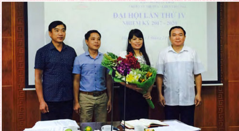
Đại hội Chi bộ Vụ Thi đua - Khen thưởng, nhiệm kỳ 2017-2020 (Hà Nội, Tháng 7/2020)