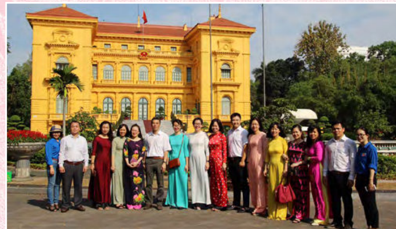
Chi bộ Vụ Pháp luật quốc tế tổ chức sinh hoạt chuyên đề học tập và làm theo tư tưởng, đạo đức, phong cách Hồ Chí Minh tại khu di tích Phủ Chủ tịch (Hà Nội, ngày 19/5/2020)