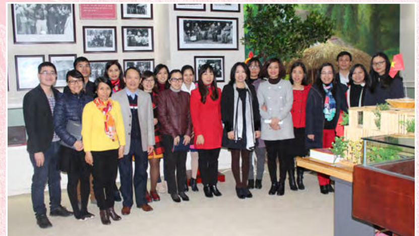
Chi bộ Cục Bổ trợ tư pháp thăm quan, nghiên cứu và tổ chức sinh hoạt chuyên đề tại Phòng truyền thống Bộ Tư pháp (Hà Nội, ngày 24/02/2016)