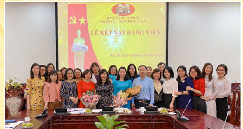
Chi bộ cơ sở Cục Trợ giúp pháp lý tổ chức kết nạp đảng viên mới (Hà Nội, ngày 03/3/2020)