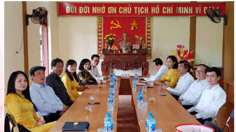
Các thể hệ công chức Văn phòng Đảng - Đoàn thể tại buổi sinh hoạt chuyên đề giáo dục truyền thống nhân kỷ niệm 05 năm thành lập (Tuyên Quang, ngày 25/10/2019)