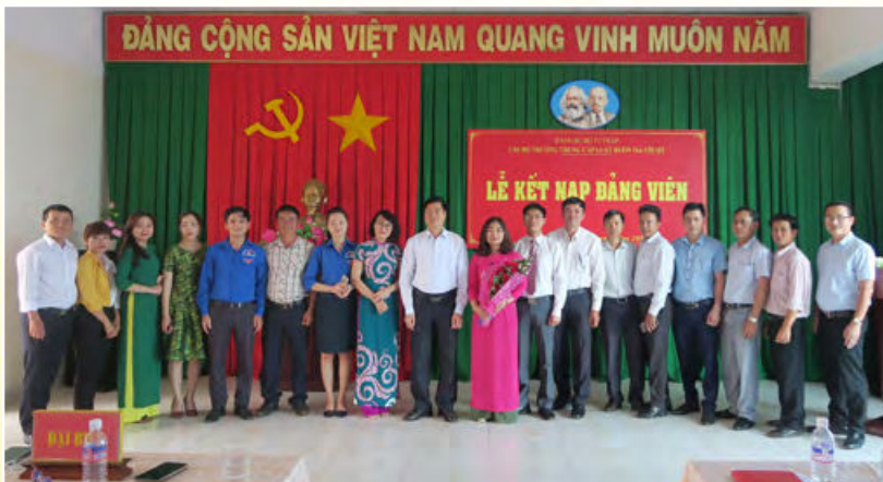
Chi bộ cơ sở Trường Trung cấp Luật Buôn Ma Thuột tổ chức kết nạp đảng viên mới (Đắk Lắk, ngày 16/3/2018)