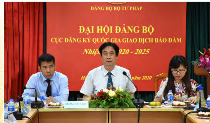
Đoàn Chủ tịch điều hành tại Đại hội Đảng bộ Cục Đăng ký quốc gia giao dịch bảo đảm, nhiệm kỳ 2020-2025 (Hà Nội, ngày 08/5/2020)