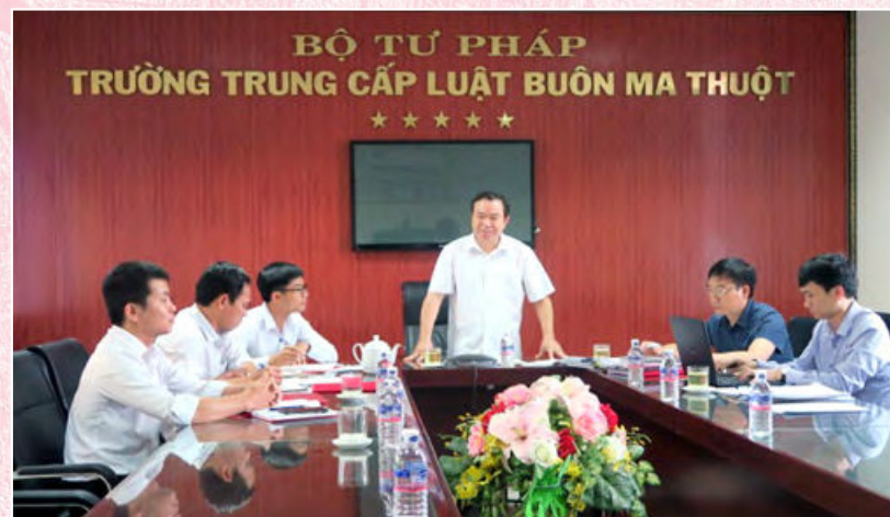
Đoàn kiểm tra của Đảng ủy Bộ Tư pháp làm việc với Chi bộ Trường Trung cấp luật Buôn Ma Thuột (Đắk Lắk, ngày 25/5/2018)