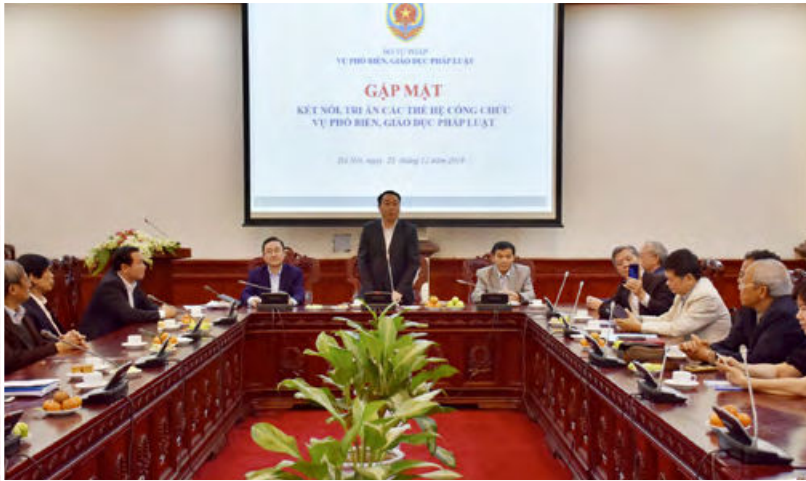
Chi bộ Vụ Phổ biến, giáo dục pháp luật tổ chức gặp mặt kết nối, tri ân các thể hệ công chức công tác tại Vụ (Hà Nội, ngày 25/12/2019)