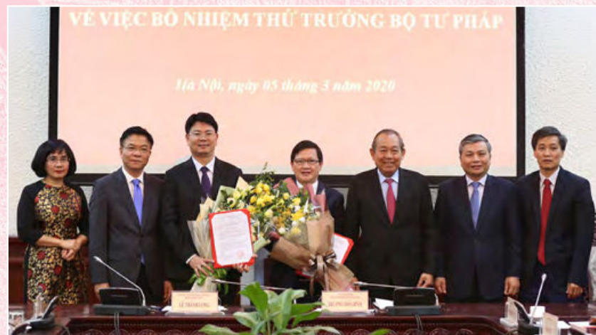
Đồng chí Trương Hòa Bình, Ủy viên Bộ Chính trị, Phó Thủ tướng Thường trực Chính phủ và tập thể Lãnh đạo Bộ tại Lễ công bố Quyết định của Thủ tướng Chính phủ về việc bổ nhiệm Thủ trưởng Bộ Tư pháp (Hà Nội, ngày 05/3/2020)