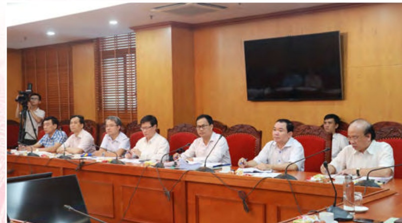
Ban Tổ chức Đảng ủy Bộ cùng Thường trực Đảng ủy Bộ báo cáo Ban Thường vụ Đảng ủy Khối các cơ quan Trung ương về công tác nhân sự Đại hội Đảng bộ Bộ Tư pháp nhiệm kỳ 2020-2025 (Hà Nội, ngày 18/6/2020)