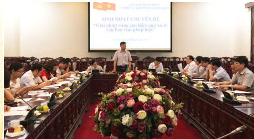
Chi bộ cơ sở Cục Kiểm tra văn bản quy phạm pháp luật tổ chức sinh hoạt chuyên đề gắn với hoạt động chuyên môn (Hà Nội, ngày 08/5/2020)