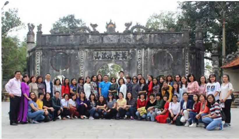
Công đoàn Bộ Tư pháp tổ chức các hoạt động giáo dục truyền thống cho công đoàn viên Bộ Tư pháp (Kiếp Bạc, năm 2018)