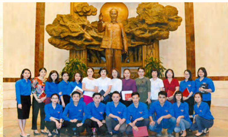
Đảng bộ Tổng cục Thi hành án dân sự tổ chức hoạt động giáo dục truyền thống và học tập, làm theo tư tưởng, đạo đức, phong cách Hồ Chí Minh nhân Ngày truyền thống Ngành Thi hành án dân sự (Hà Nội, Tháng 5/2019)