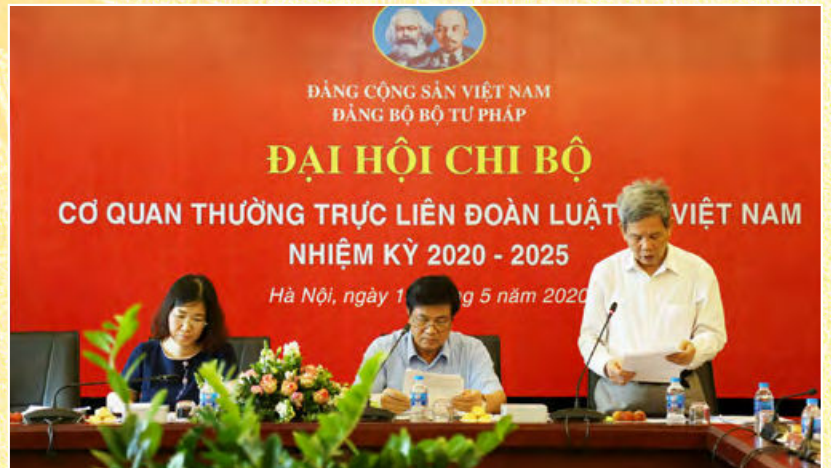
Đoàn Chủ tịch Đại hội Chi bộ cơ sở Cơ quan thường trực Liên đoàn luật sư Việt Nam, nhiệm kỳ 2020-2025 (Hà Nội, ngày 17/5/2020)