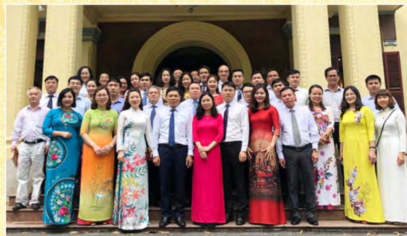
Ban Chấp hành và đảng viên của Đảng bộ Văn phòng Bộ (Hà Nội, ngày 23/5/2020)