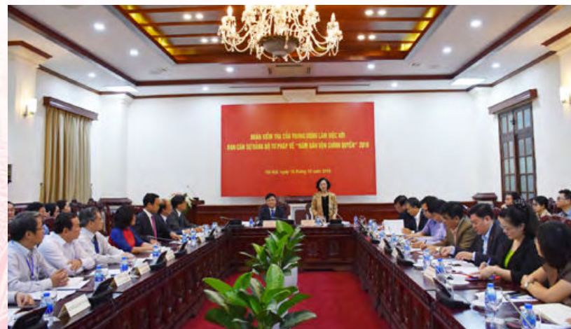
Đồng chí Trương Thị Mai, Ủy viên Bộ Chính trị, Trưởng Ban Dân vận Trung ương làm việc với Ban cán sự Đảng và Đảng ủy Bộ Tư pháp về “Năm dân vận chính quyền” 2018 (Hà Nội, ngày 16/10/2018)