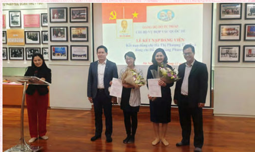
Chi bộ Vụ Hợp tác quốc tế tổ chức kết nạp đảng viên mới (Hà Nội, Tháng 12/2019)