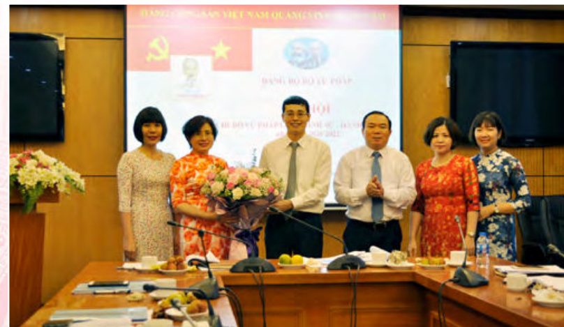
Lễ ra mắt chi ủy Chi bộ tại Đại hội Chi bộ Vụ Pháp luật hình sự - hành chính nhiệm kỳ 2020-2022 (Hà Nội, ngày 14/5/2020)