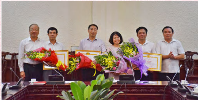
Thường trực Đảng ủy Bộ Tư pháp trao Bằng khen của Đảng ủy Khối các cơ quan Trung ương cho các đảng viên hoàn thành xuất sắc nhiệm vụ 05 năm liền 2013-2017 (Hà Nội, ngày 09/01/2017)