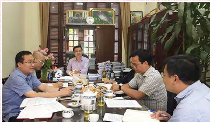
Ban Tuyên giáo Đảng ủy Bộ triển khai nhiệm vụ công tác năm 2019 (Hà Nội, ngày 11/7/2019)