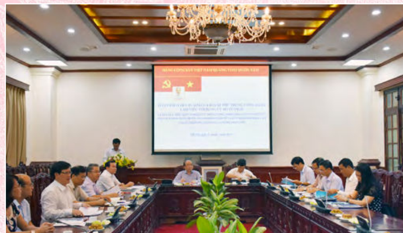
Đoàn Kiểm tra của Ban Bí thư Trung ương Đảng làm việc với Đảng ủy Bộ Tư pháp về thực hiện Nghị quyết Trung ương 4 khóa XII, các Quy định của Trung ương về trách nhiệm nêu gương (Hà Nội, ngày 31/7/2019)