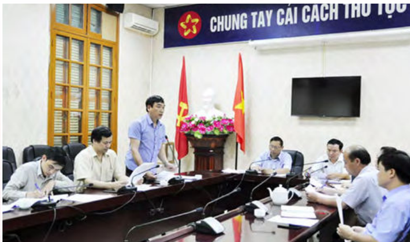
Thường trực Đảng ủy Bộ tham dự phiên họp triển khai nhiệm vụ công tác của Ủy ban Kiểm tra Đảng ủy Bộ (Hà Nội, năm 2015)