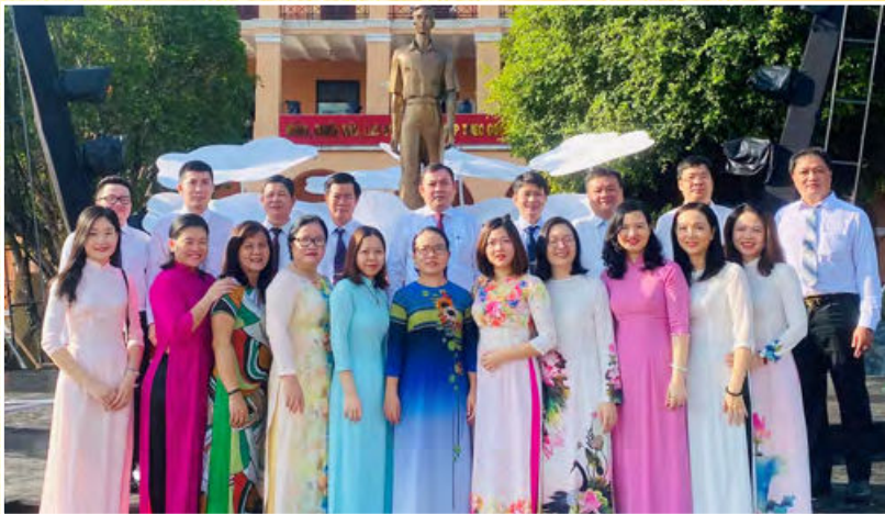
Chi bộ cơ sở Cục Công tác phía Nam tổ chức sinh hoạt chuyên đề nhân kỷ niệm 130 năm ngày sinh Chủ tịch Hồ Chí Minh và chào mừng thành công Đại hội Chi bộ Cục Công tác phía Nam nhiệm kỳ 2020-2025 (Bến Nhà Rồng, ngày 19/5/2020)