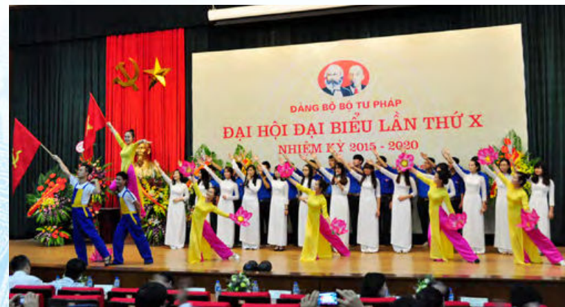
Các hoạt động văn nghệ của Đoàn Thanh niên Bộ Tư pháp chào mừng Đại hội đại biểu Đảng bộ Bộ Tư pháp lần thứ X, nhiệm kỳ 2015-2020 (Hà Nội, ngày 27/8/2015)