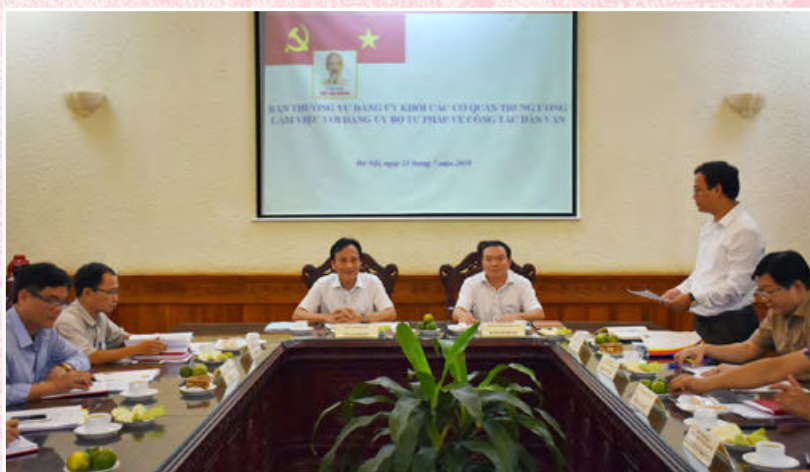
Đoàn Kiểm tra của Đảng ủy Khối các cơ quan Trung ương làm việc với Đảng ủy Bộ Tư pháp về công tác dân vận (Hà Nội, ngày 23/7/2019)