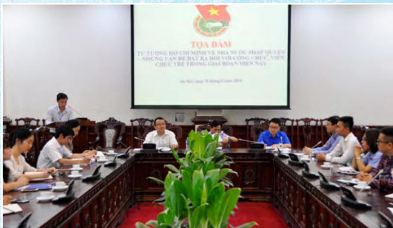
Đoàn Thanh niên Bộ Tư pháp tổ chức sinh hoạt chuyên đề “Tu tưởng Hồ Chí Minh về nhà nước pháp quyền những vấn đề đặt ra đối với công chức, viên chức trẻ trong giai đoạn hiện nay” (Hà Nội, ngày 16/5/2018)