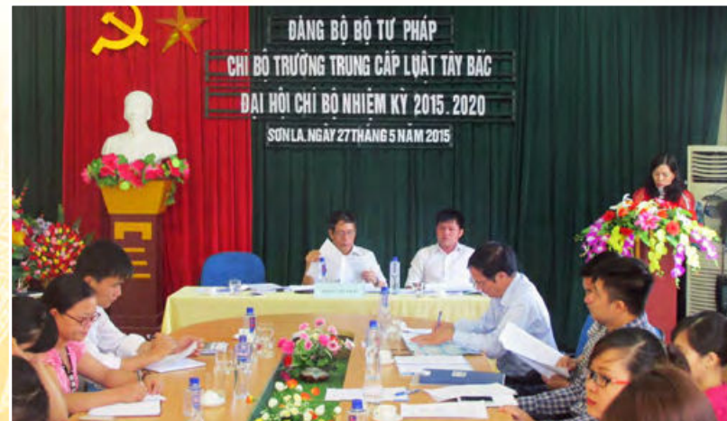
Đại hội Chi bộ cơ sở Trường Trung cấp Luật Tây Bắc nhiệm kỳ 2015-2020 (Sơn La, ngày 27/5/2015)