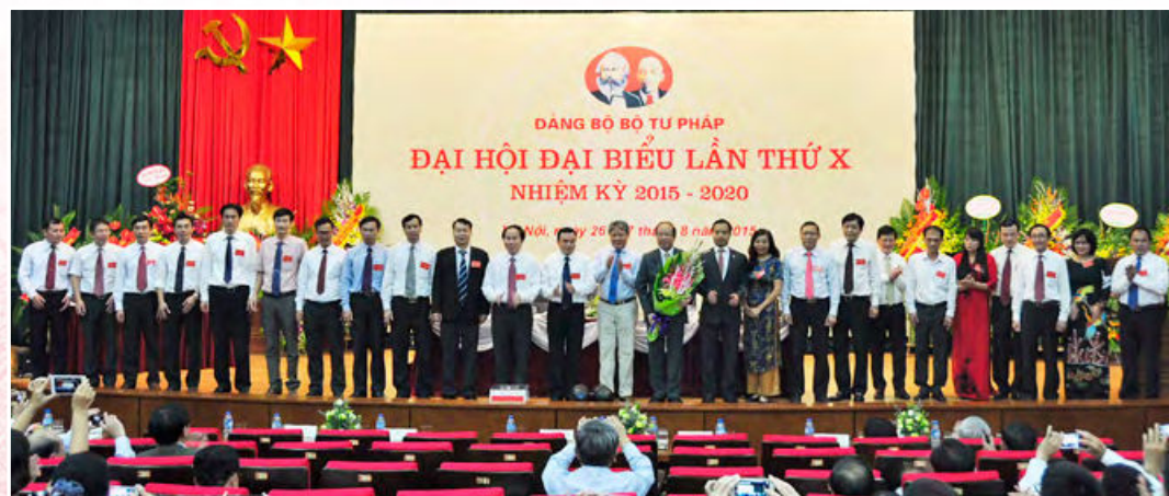
Ban Chấp hành Đảng Bộ trong buổi ra mắt tại Đại hội Đại biểu Đảng bộ Bộ Tư pháp lần thứ X, nhiệm kỳ 2015 - 2020 (Hà Nội, ngày 27/8/2015)