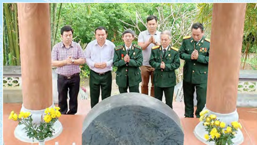
Hội Cựu chiến binh Bộ Tư pháp thăm lại chiến trường xưa (4.4.2019)