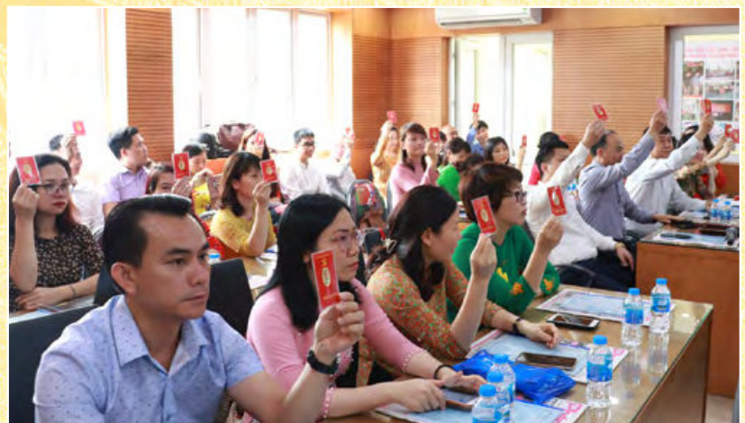
Đại hội Đảng bộ Báo Pháp luật Việt Nam lần thứ II, nhiệm kỳ 2020-2025 (Hà Nội, ngày 08/5/2020)