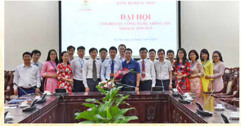
Tập thể đảng viên tại Đại hội Chi bộ cơ sở Cục Công nghệ thông tin, nhiệm kỳ 2020-2025 (Hà Nội, ngày 20/5/2020)