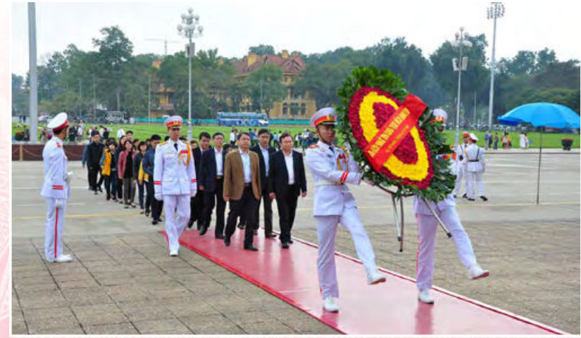
Chi bộ Vụ Tổ chức cán bộ tổ chức để cán bộ, đảng viên vào Lăng viếng Chủ tịch Hồ Chí Minh (Hà Nội, Tháng 5/2020)