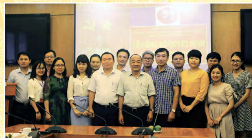
Lễ công bố Quyết định nâng cấp Chi bộ trực thuộc Cục Quản lý xử lý vi phạm hành chính và theo dõi thi hành pháp luật lên Chi bộ cơ sở (Hà Nội, ngày 21/9/2018)