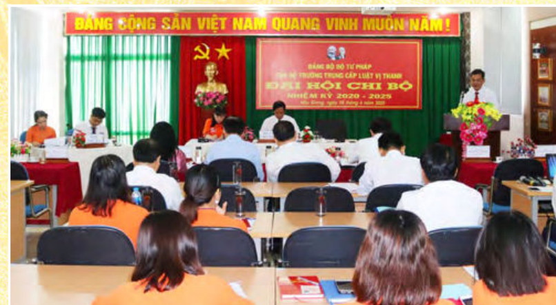
Đại hội Chi bộ cơ sở Trường Trung cấp Luật Vụ Thanh, nhiệm kỳ 2020-2025 (Vụ Thanh, ngày 05/6/2020)